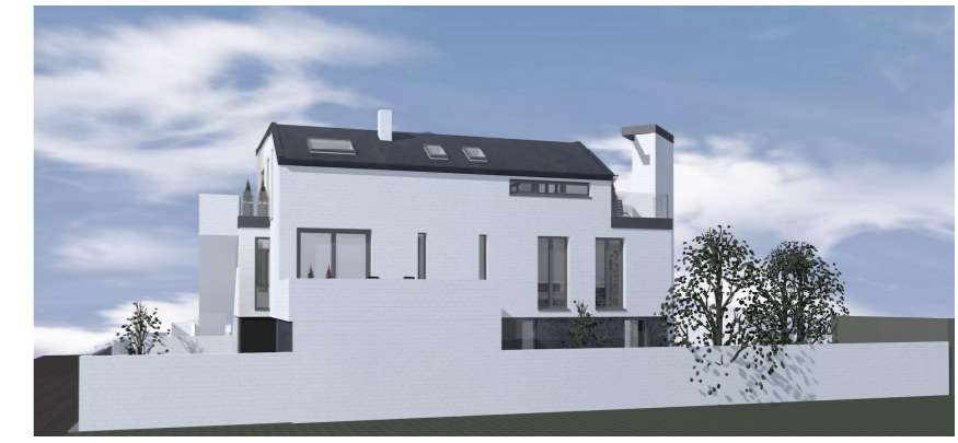
PERSPEKTIVE NORD-WEST (OHNE MASZSTAB)