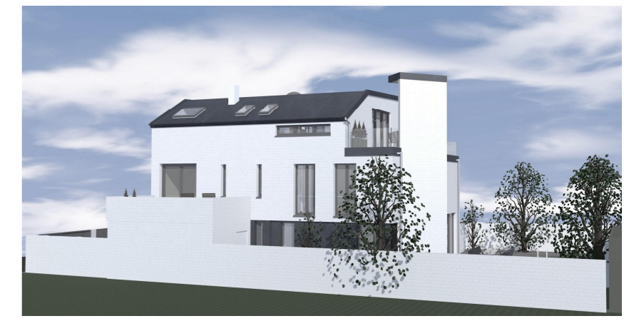
PERSPEKTIVE WEST (OHNE MASZSTAB)

ARCHITECTURATELIER DIPL.-ING. GABRIELE SCHEIDT AKNW